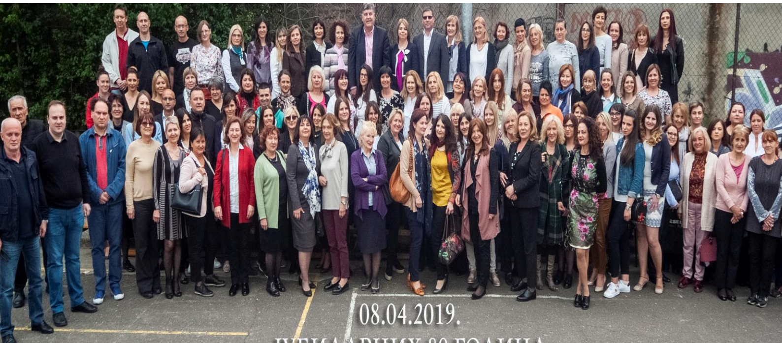
Београд, април 2019.